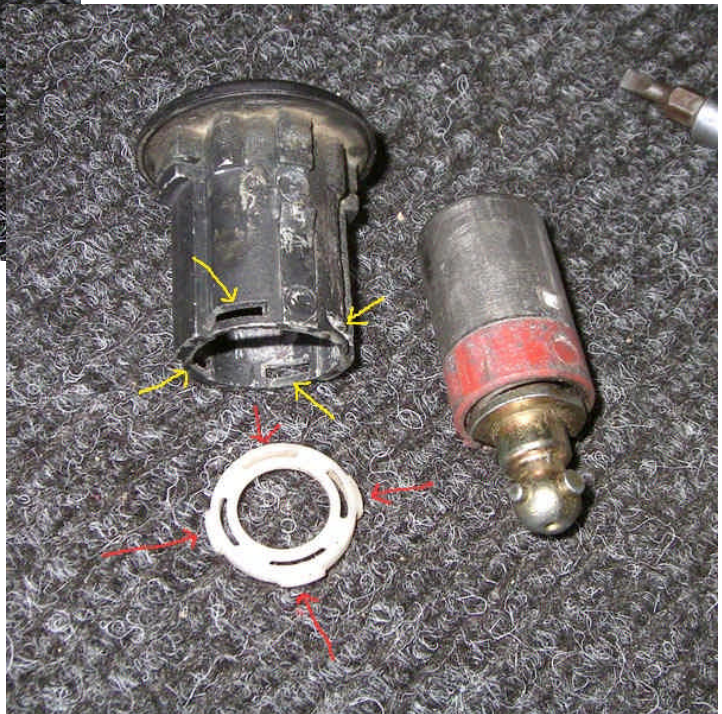
10. ábra: A ZÁR SZÉTSZEDVE

A zárbetétet és a hüvelyt is meg kell tisztítani, nálam valamilyen vízkőszerű lerakódás volt rajtuk. A csiszolást nem javaslom, hátha túlságosan megkarcolódik a cucc, egyszerűen egy késsel le kell kapargatni a mocskot. A tok peremes végén van egy tömítőgyűrű a belső oldalon, ezt lehetőleg ne sértsük meg, mert valamennyire azért véd a behatoló víztől. Miután minden alkatrész tiszta, zsírozzuk be a hengert és rakjuk össze.