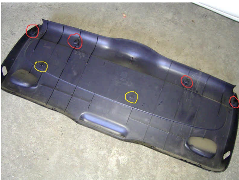
3. ábra: A PATENTOK