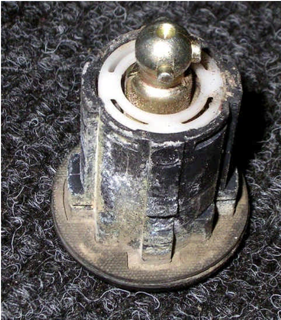
9. ábra: KOMPLETT ZÁR