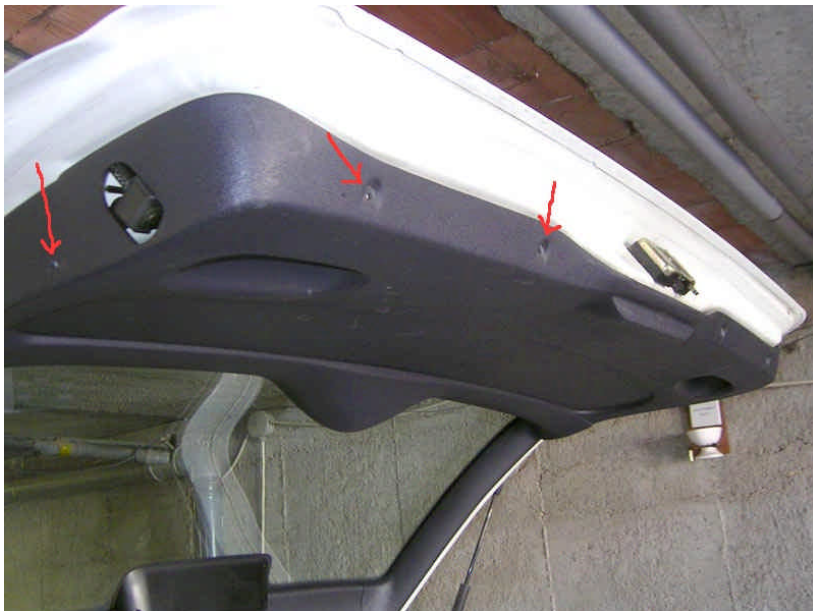
1. ábra: A FELFOGATÁSI PONTOK

Eredmény: széles mosoly és nem kell a kulcs a hátsó ajtó nyitásához.