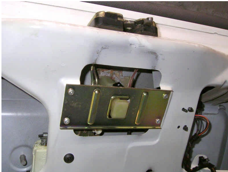
4. ábra: TAKARÓLEMEZ

A zárszerkezetet egy lemez takarja 4 csavarral, ezt is leszedjük.