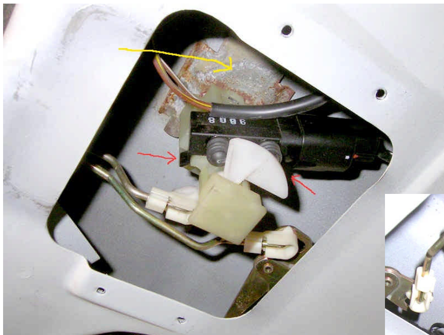
5. ábra: A MECHANIZMUS

A zárat valójában elektromotor működteti, ennek a kapcsolója látszik az 5. ábrán, az a fekete doboz. Praktikus levenni, mert a babrálás közben többször is nyitogathat, ha véletlenül megnyomjuk. Két fül tartja (piros nyilak), de óvatosan húzzuk le, mert két stift is megy belőle, ami a helyén tartja. Ezeket a 6. ábrán jobban látni.