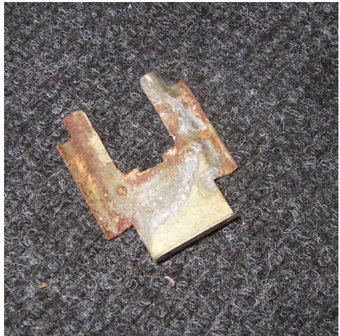
8. ábra: RETESZLEMEZ

Ezután már csak a hengert tartó reteszt (8. ábra) kell kihúznunk és kiemelhető a zárbetét. A lemezkét az 5. ábrán sárga nyíllal jelöltem