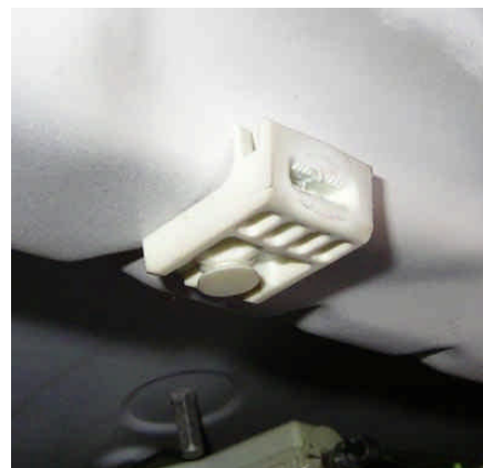
2. ábra: CSAVAR HÁTTÁMASZ

Először is az ajtó borításától kell megszabadulni (esetünkben kombi ajtót tárgyalunk, a többinél egyéni leleményesség szükséges). Ezt oldalanként 3 csavar és belül műanyag patentok tartják. A csavarok helyét az 1. ábra mutatja, a patentokat a 3. ábrán jelöltem: pirossal bordás hengerek, sárgával bepattintós fűlek. Kell egy kis bátorság, de legfőképpen óvatosság a leszedéséhez, nehogy eltörjük őket. A 2. ábrán a csavarok háttámasza van.